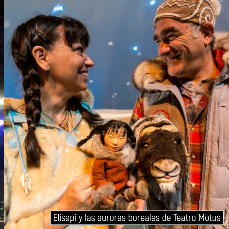
Elisapi y las auroras boreales de Teatro Motus