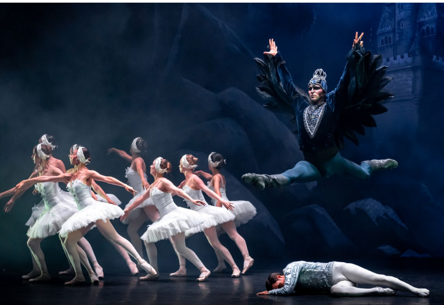
Lago de los Cisnes